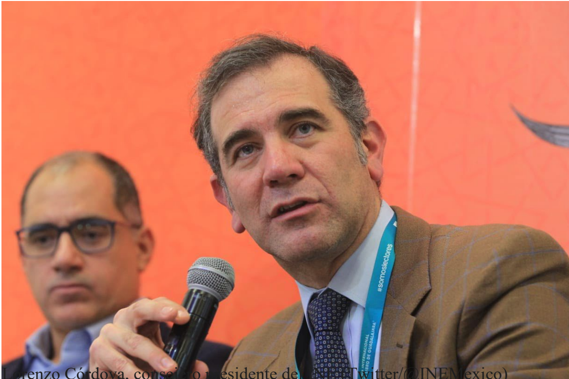
Lorenzo Córdova, consejero presidente de INE (@LorenzoCordova on Twitter/@INEMexico)

Por ello, el consejero destacó que la presencia territorial es indispensable porque se requiere que el personal sea de la zona y “una elección no se construye de la noche a la mañana” como lo pretende la reforma electoral, por lo que se pone en riesgo que no se instalen casillas y que el personal sea capacitado de manera adecuada como hoy lo hace el INE.