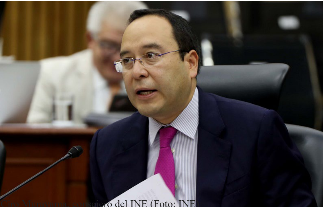
Ciro Murayama, consejero del INE

“El plan B de AMLO del gobierno pretende que estos módulos del INE desaparezcan y se muevan a oficinas gubernamentales sin las condiciones técnicas de seguridad necesarias para salvar tu información y tus datos personales”, aseveró.